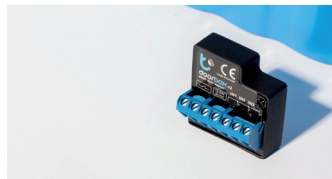
Moduł przekaźnikowy tedee

Podłącz bridge do internetu, aby sterować zamkiem tedee z dowolnego miejsca na świecie. Otwieraj drzwi zdalnie, sprawdzaj status zamka w czasie rzeczywistym i kontroluj wszystko za pomocą dedykowanej aplikacji na telefon.